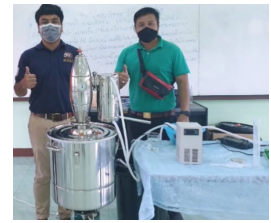
เครื่องกลั่นสมุนไพร น้ำมันหอมระเหย