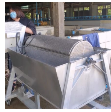
เครื่องขูดเกล็ดปลา อัตโนมัติ