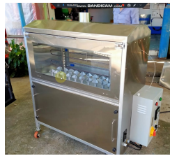
เครื่องเผาข้าวหลาม